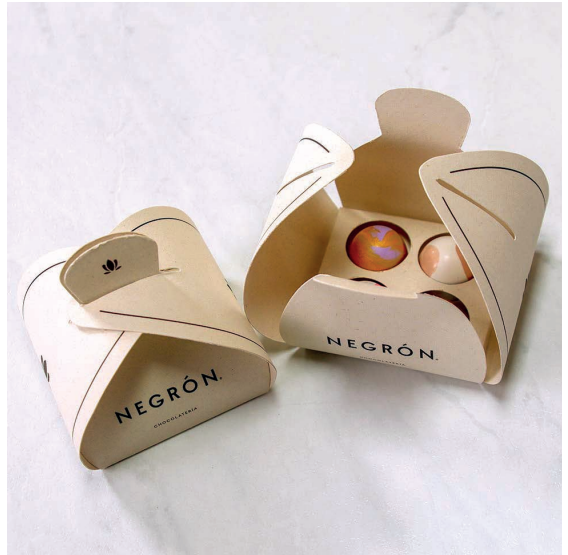
Bombones X4 $ 27.000