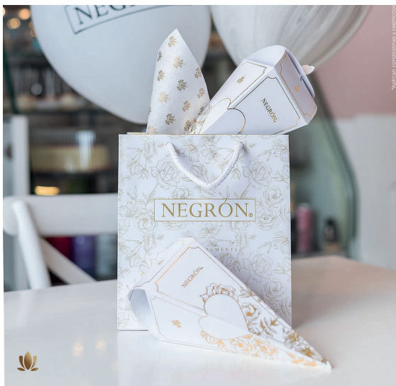
Conos Amore White $ 80.000