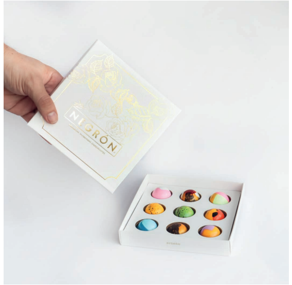
Bombones White X9 $ 75.000