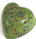
Pie de limón