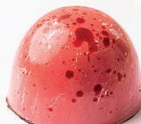
Cheesecake frutos rojos