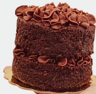
CHOCOLATE PERSONAL $44.000