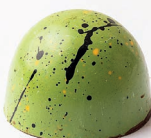
Pie de limón