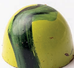
Limonada de coco