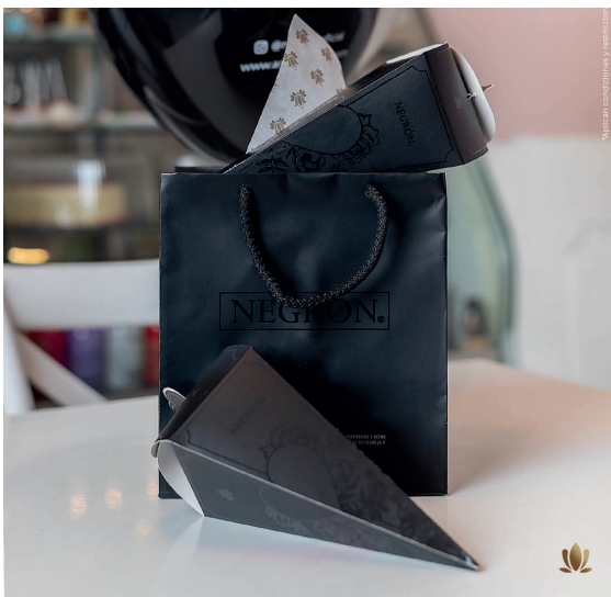
Conos Amore Black $ 80.000