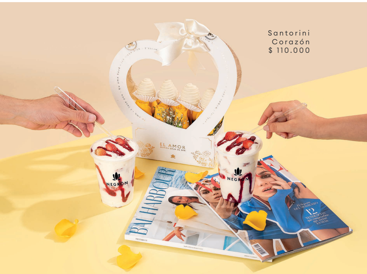
Santorini Corazón $ 110.000

“Vive la magia de sorprender a quien amas”