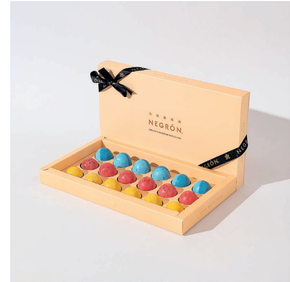
Bombones Peach X18 $ 110.000