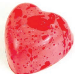
Cheesecake frutos rojos