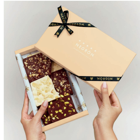
Caja de Chocolate Bites Peach $ 90.000