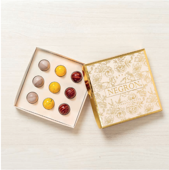
Bombones Shiny X9 $ 75.000

Elige entre nuestras opciones de bombones: cítricos, licores, clásicos frutales, sin azúcar, o una selección combinada