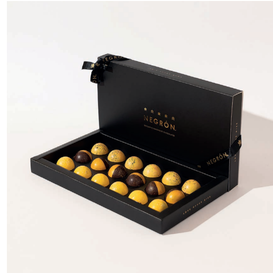
Bombones Black X18 $ 110.000

Elige entre nuestras opciones de bombones: cítricos, licores, clásicos frutales, sin azúcar, o una selección combinada