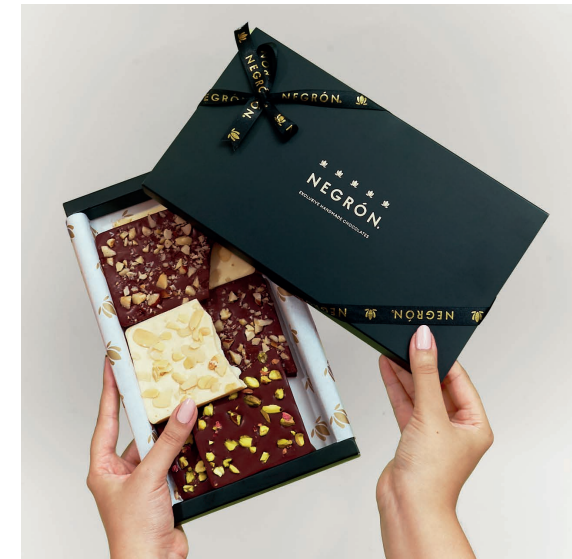
Caja de Chocolate Bites Black $ 90.000