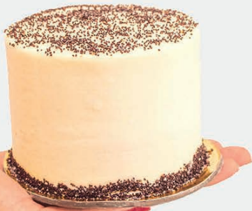
AMAPOLA PERSONAL $44.000