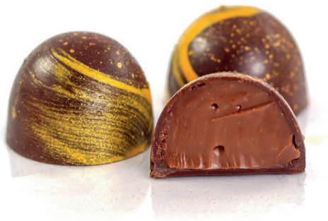
Bombón x1 Und $ 7.000