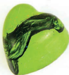
Limonada de coco